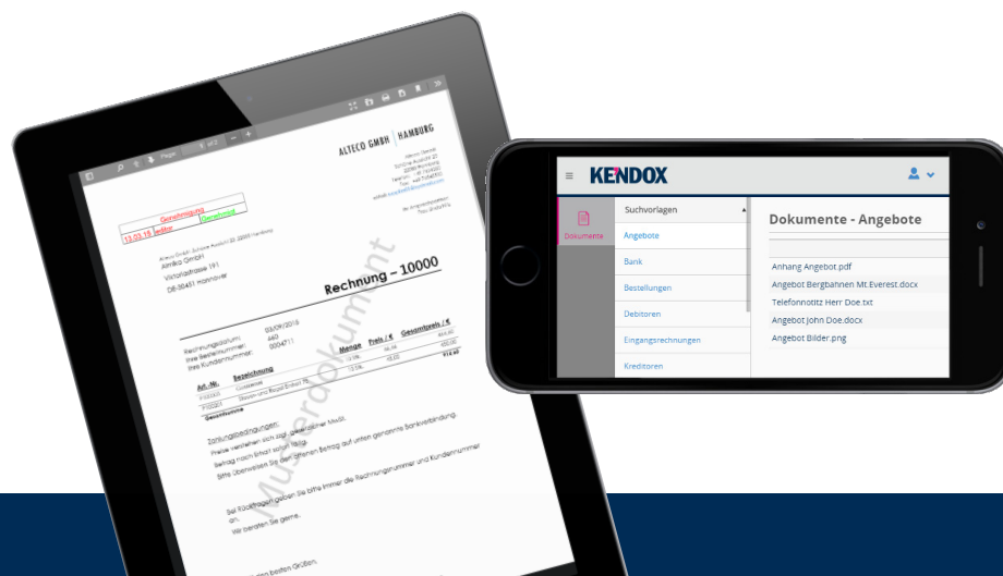
Kendox InfoShare HTML5 Anwendung

Mit «Kendox InfoShare» kann einfach und unkompliziert mobil mit Daten und Dokumenten gearbeitet werden. Darüber hinaus kann mit «InfoShare as a Service» der gesamte Betrieb des Unternehmensarchivs ausgelagert werden, so dass nicht einmal eine eigene Archivinfrastruktur aufgebaut werden muss.