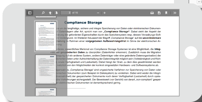
Kendox InfoShare Mobile Web Client

Und selbstverständlich können Sie das Look-and-Feel der «Kendox InfoShare» Lösung so anpassen, dass es auch optisch in Ihr Leistungsportfolio passt. Das beginnt beim Einbinden Ihres Logos und endet bei der vollständigen Verschmelzung von «Kendox InfoShare» mit Ihren bereits bestehenden Lösungen.